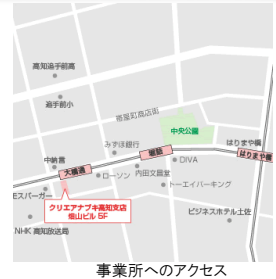
事業所へのアクセス